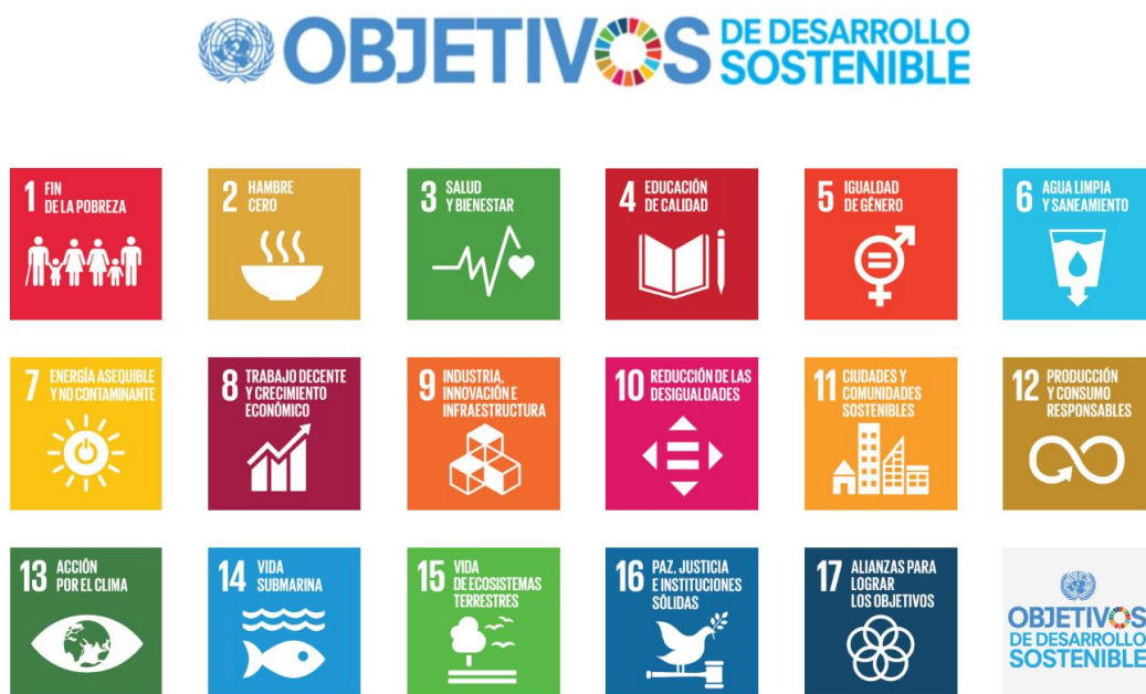
Ilustración 4: Objetivos de Desarrollo Sostenible

La Municipalidad de Zarcero dentro de su Plan de Desarrollo Municipal cuenta con objetivos y metas vinculados estrechamente con los ODS, aportando desde el Gobierno Local la ejecución y el cumplimiento de lo establecido en cada una de las metas que tiene los ODS. A continuación, se presenta una imagen con los ODS que deberán ser atendidos y se encuentran vinculados con los objetivos del PDM 2024-2028.