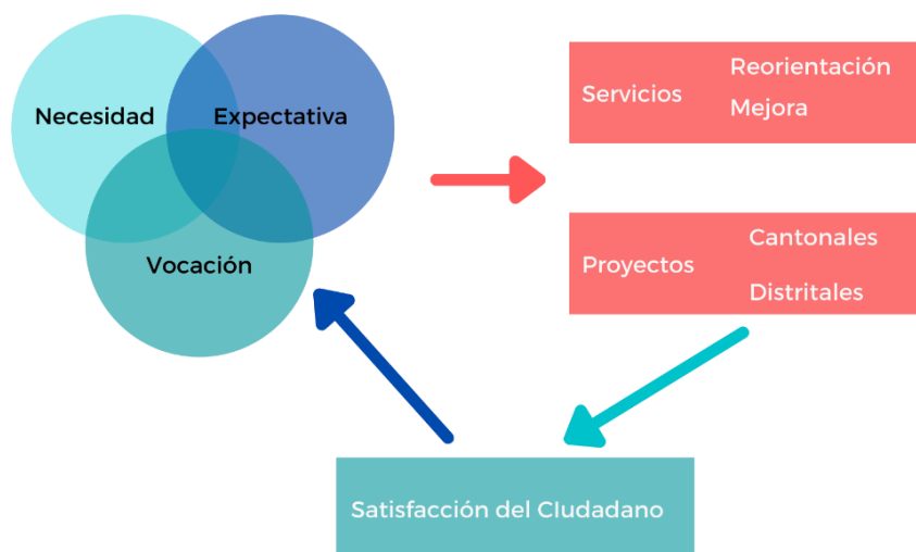
Ilustración 1. Ciclo de la generación de Valor Público

Estos tres elementos se vinculan con el establecimiento de una estrategia gestionada desde la misión y visión de la organización, ya que por medio de estas es que una organización especifica el valor público que pretende producir para las partes interesadas y para la sociedad en general (Mokate & Saavedra, 2006).